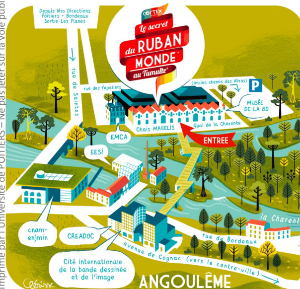
Plan d'accès au Tumulte® ; © Alexandre Clérissé

Imprimé par l'Université de POITIERS – Ne pas jeter sur la voie publique