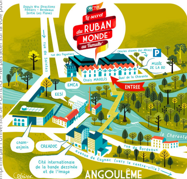
Plan d'accès au Tumulte® ; © Alexandre Clérissé

Imprimé par l'Université de POITIERS – Ne pas jeter sur la voie publique