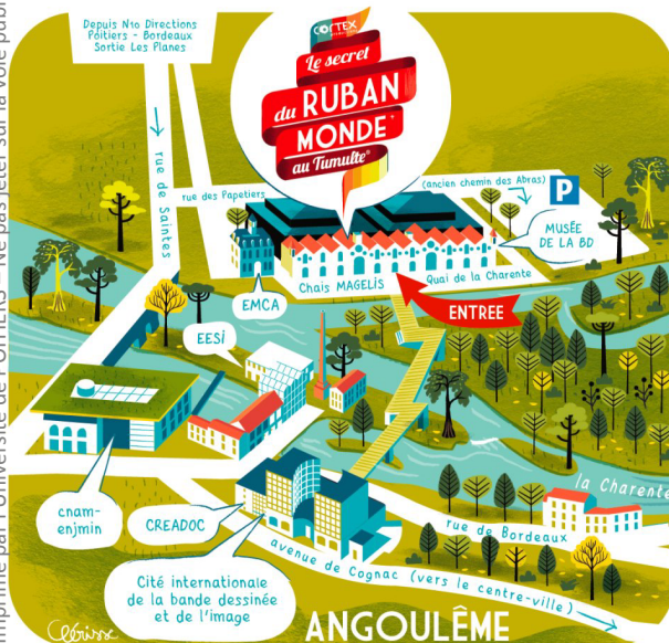
Plan d'accès au Tumulte® ; © Alexandre Clérissé

Imprimé par l'Université de POITIERS – Ne pas jeter sur la voie publique