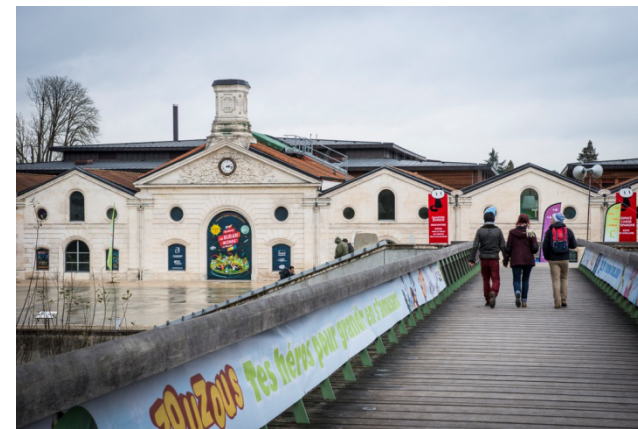
Chais Magelis

Le Tumulte® est installé dans le bâtiment du Musée de la BD, au bord de la Charente : Chais Magelis – Quai de la Charente 16000 Angoulême