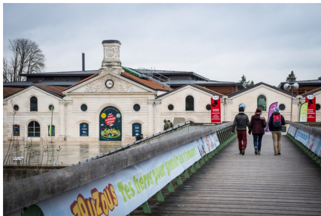
Chais Magelis