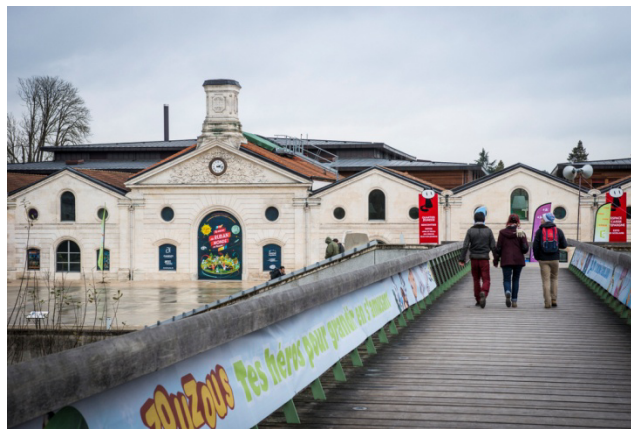
Chais Magelis